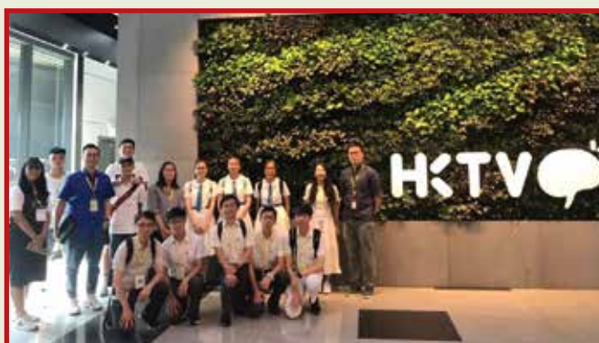
Group photos at Hong Kong Television Network Limited