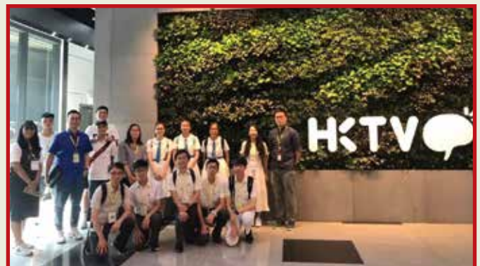
Group photos at Hong Kong Television Network Limited