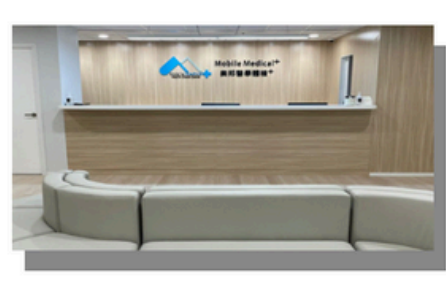
Yuen Long (New Territories West)