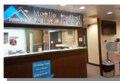
Tsuen Wan West (New Territories)