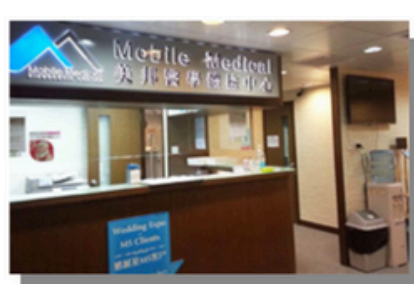
Tsuen Wan West (New Territories)