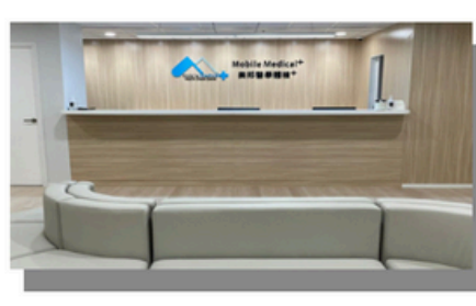
Yuen Long (New Territories West)